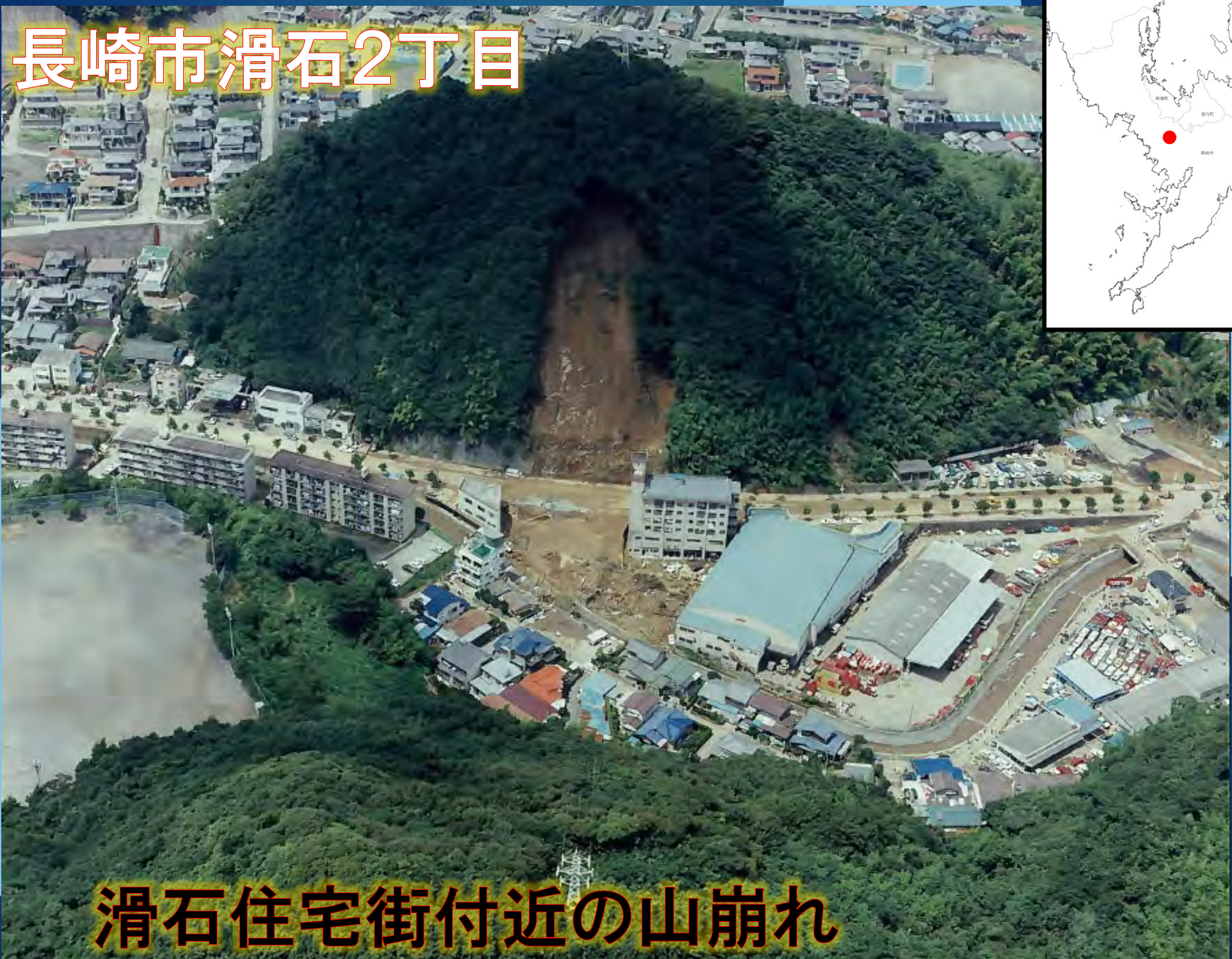
滑石住宅街付近の山崩れ