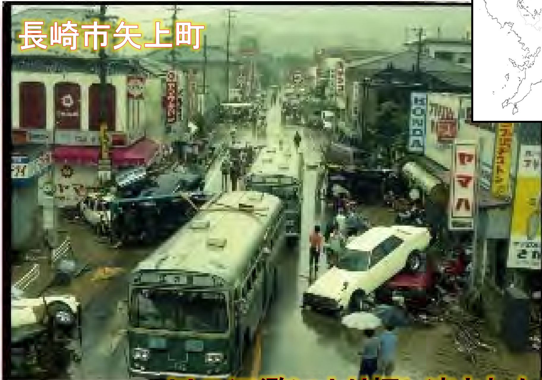
川の氾濫により押し流された車