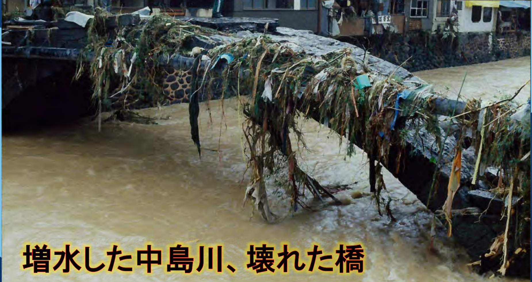
増水した中島川、壊れた橋