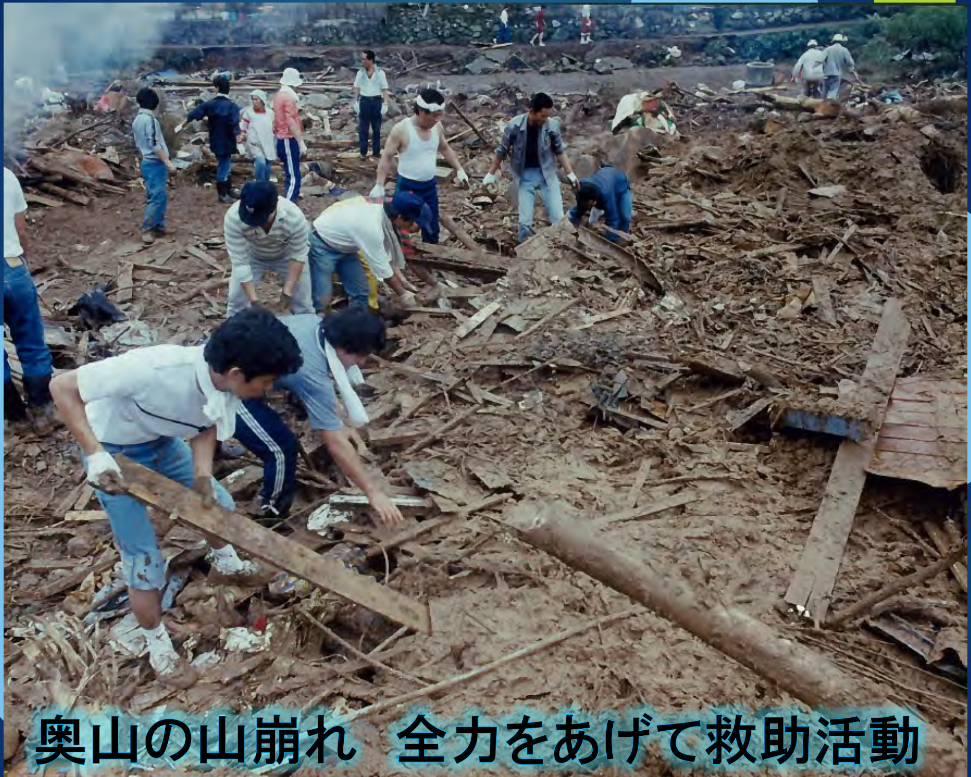
奥山の山崩れ 全力をあげて救助活動