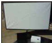
プロジェクター、 大型スクリーン、 ノートパソコン