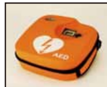
A E D