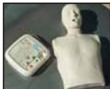
AEDトレーナーセット