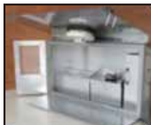
天ぶら油実験装置