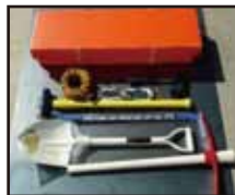
レスキューキット