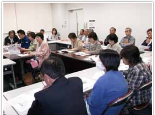
地域減災リーダーの研修の様子