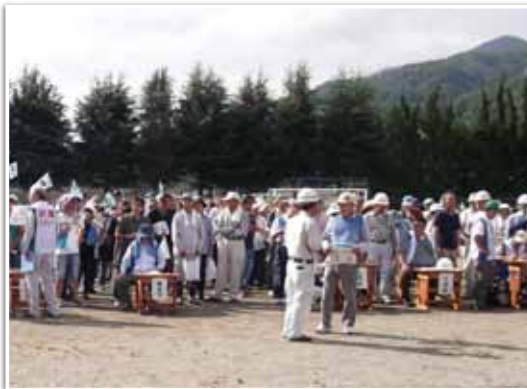
特定地区総合防災訓練

これまで市の災害対策本部と地域の協働訓練がなかったことから、毎年1か所の指定避難所を選び、いざという時にその施設を利用する対象地区住民と協働訓練を実施することで、地域が実践的な減災力を高めていけるよう指導しています。