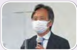
名古屋大学教授の坪木和久氏