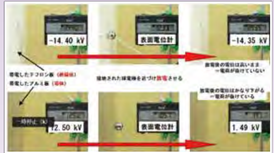
絶縁体(上段)と導体(下段)の放電前後の帯電電位の変化