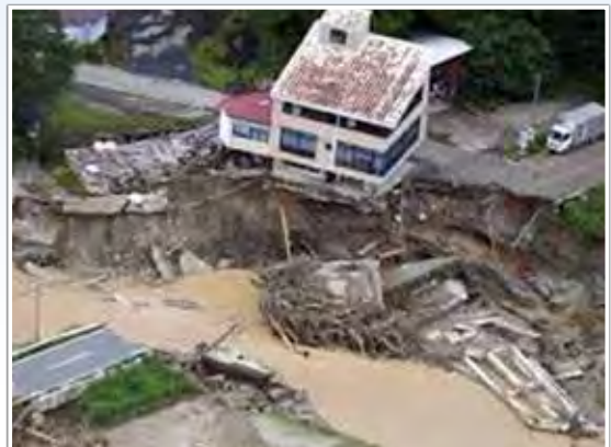
山形県飯豊町(豪雨:8月4日(木))