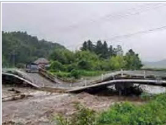
宮城県大崎市岩出山(台風4号・豪雨:7月上旬)