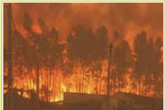
フランス南部（山林火災：7月上旬）