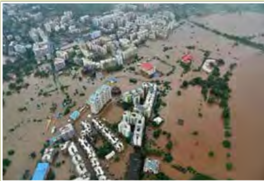
インド北東部（洪水：6月中）

世界では、令和4年6月から7月にかけて、世界各地で土砂崩れや洪水（インド、中国、オーストラリア等）、地震（アフガン、フィリピン等）及び山火事（スペイン、フランス、ポルトガル、イギリス、米国、モロッコ等）などの災害が発生しました。写真はその被害状況を一部抜粋しております。