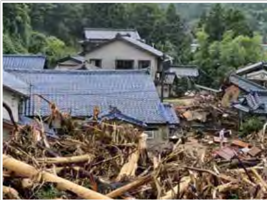
新潟県村上市（豪雨：8月4日（木））