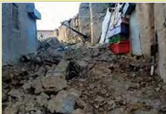
アフガニスタン東部（地震：6月21日（火））