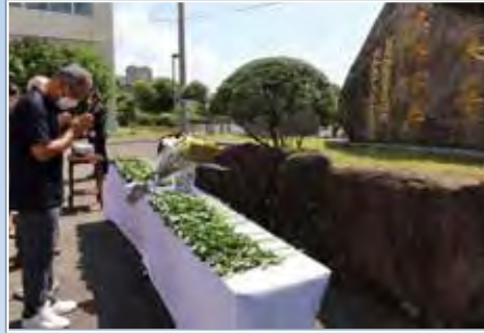
長崎市日見地区ふれあいセンター

昭和57年(1982年)7月23日(金)の豪雨災害で299名が亡くられました(本誌2020年10月号・12月号参照)。