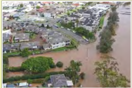
オーストラリア東部（洪水：7月上旬）