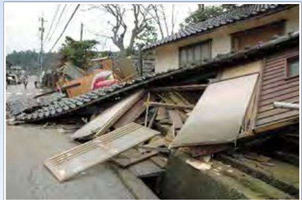
石川県輪島市(能登沖地震:6月25日(土))

日本では、令和4年6月から8月上旬にかけて、能登沖地震、台風4号・豪雨災害が発生し、また、線状降水帯による災害が各地で発生しました。写真はその被害状況を一部抜粋しております。