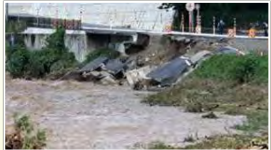
滋賀県長浜市（豪雨：8月5日（金））