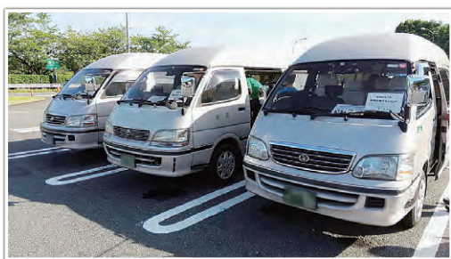
ボランティアバス

県によるボランティアバスの運行は、ボランティアの確保だけでなく、災害ボランティアセンター業務の負担軽減、交通渋滞の緩和などの効果も得られました。