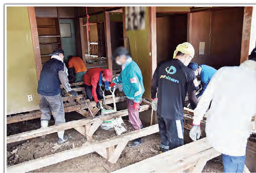
被災家屋の泥出しをするボランティア