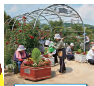
フラワープランター